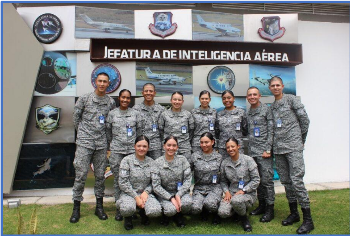
Visita geoestratégica al área funcional