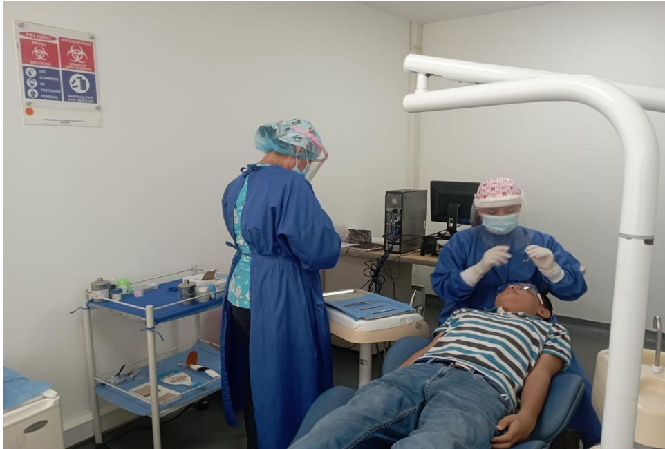
Proyecto Educativo del Programa TGA 61